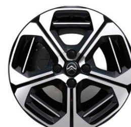
Hliníkový disk ARAGONITE 17" – s výbrusem