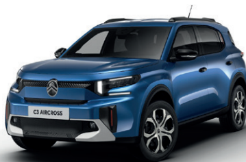
Modrá BRIGHT (M)