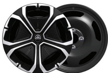
Okrasný kryt TITANITE 16"