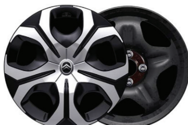
Okrasný kryt SYLVANITE 17"